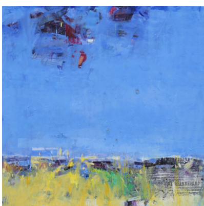
Manhal Issa, Vers le Haut, 2020 Acryl auf Leinwand, 200 x 200 cm