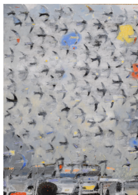
Sabour, Auswanderung, 2022 Mischtechnik auf Leinwand,