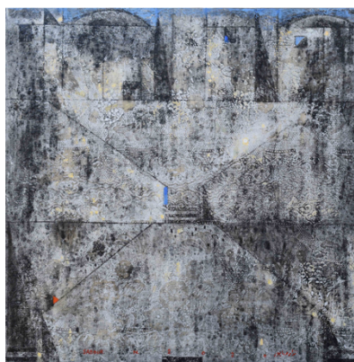
Nizar Sabour, Städte an der Küste, 2020 Mischtechnik auf Leinwand, 50 x 50 cm