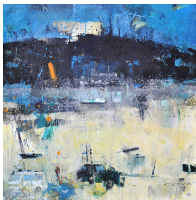
Manhal Issa, Un jour à Damas, 2022 Acryl auf Leinwand, 90 x 90 cm