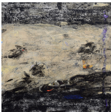
Nizar Sabour, Zerrissenes Syrien, 2011 Mischtechnik auf Leinwand, 100 x 100 cm